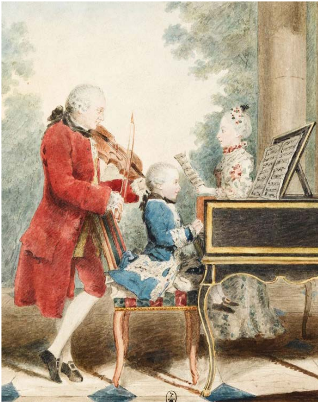
„Nach Gott kommt gleich der Papa.“ (W. A. Mozart)

Vor 300 Jahren, am 14. November 1719, wurde Leopold Mozart in Augsburg geboren. Nach einer vortrefflichen humanistischen und musikalischen Ausbildung ging er nach Salzburg, um sich dort als Violinist und später als Vizekapellmeister in den Dienst des Erzbischofs zu stellen. Zeitgleich mit Leopold Mozart waren hier auch J. E. Eberlin und Michael Haydn tätig. Alle drei Salzburger Musiker haben das heranwachsende Genie Wolfgang Amadeus Mozart geprägt. Mit Messvertonungen der vier Komponisten bringen wir Ihnen die allsonntägliche kirchenmusikalische Praxis am Salzburger Dom um die Mitte des 18. Jahrhunderts nahe.