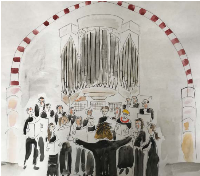
Anonyme Zeichnung: Chorkonzert in Wormbach